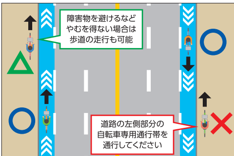
【図1】自転車専用通行帯がある場合