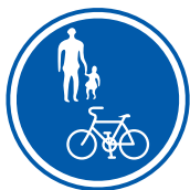
自転車歩道通行可の標識

しかし「 自転車歩道通行可 」の標識がある場合【図2】は、歩道の車道側端を相互通行する事ができます。